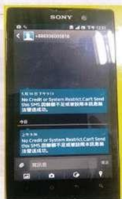
接到系統通知餘額 不足(易付卡)