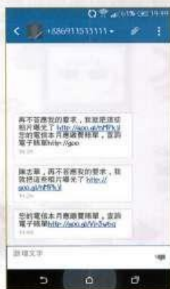
接到惡意簡訊 並點擊連結