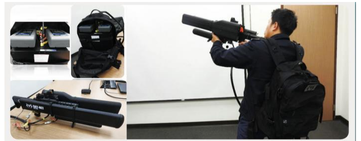
無人機干擾槍。