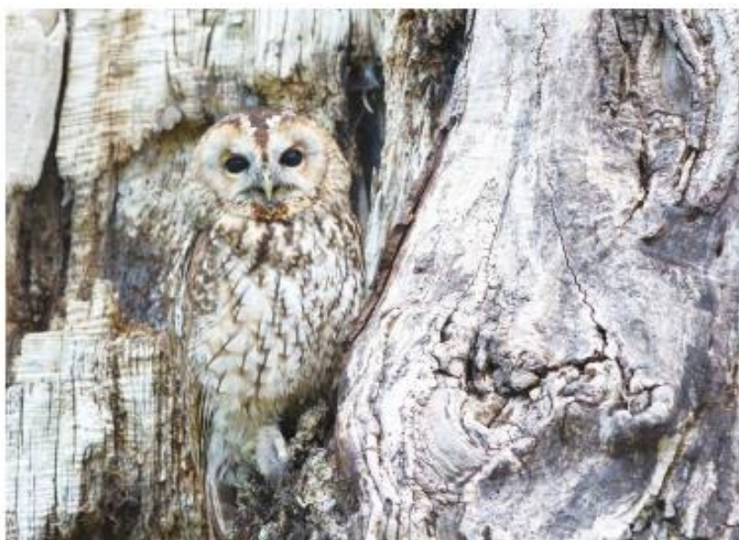
大自然生態中，許多動植物都是偽裝專家，多媒體訊息在資安領域裡亦為偽裝大師。

偽裝，不只發生在大自然裡，在生存遊戲中，更是「適者生存」的重要工具。人類歷史在偽裝運用上頗精彩絕倫，尤其在戰爭史實上，最讓人嘖嘖稱奇。看似無奇的一頭秀髮，當剃光頭髮後，竟看到機密訊息，得以完成戰事攻防裡，祕密通訊的目的。