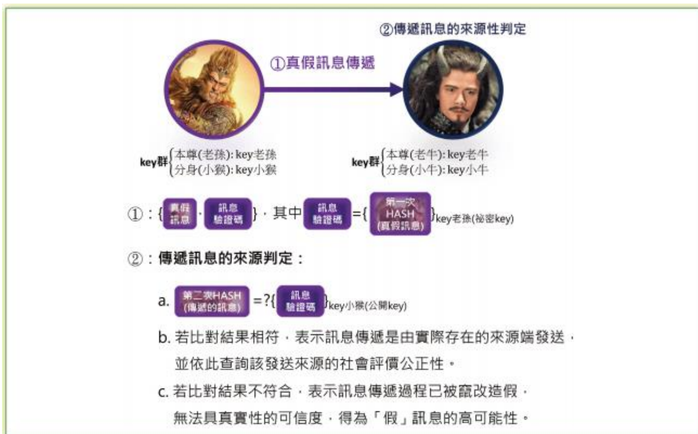
圖 1 PK 系統與 HASH 的搭配處理

另外訊息傳遞的第二個情形是，權責單位的確發布事實訊息，但發布的訊息被蓄意先下架，內容遭竄改後，例如把褒獎令的內容改掉，再進行發布。此情形裡，發布的權責單位是對的，但是內容是被改過的。但是在這一個過程中加上一個 HASH，就可以把這問題爭議處降到最低，因為依照所提到的密碼技術概念，HASH 這武器可清楚證明訊息是否被造假竄改。例如，若今天褒獎令的訊息裡有相關人物數量的名額是「10」位，被修改成「9」位，就會發現所傳遞褒獎令的訊息經第二次 HASH 的運算後會很不一樣，所以搭配 PK 的 HASH 也是解決假訊息的關鍵技巧之一。