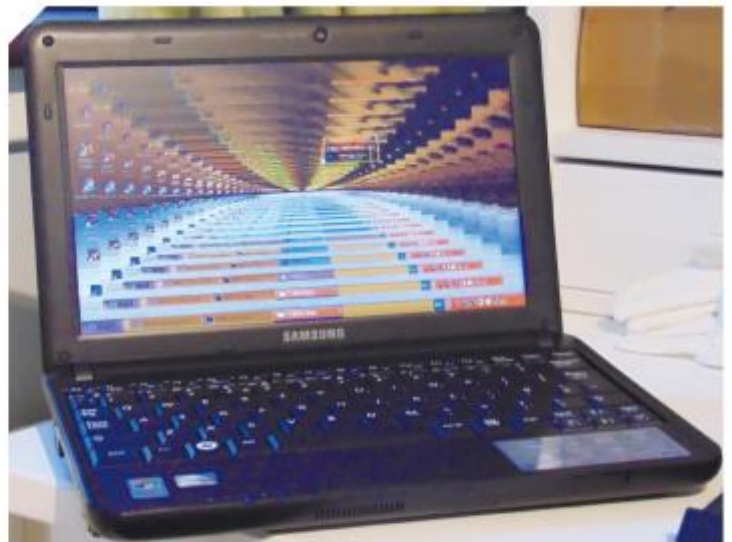
「木馬」是一種後門程式，駭客用其盜取使用者的個人訊息，甚至進行遠端控制。

這些程式碼訊息隨著時空科技的演進快速翻倍進展，早已集結各家「精華」、各路「險招」、行極「冰寒」於一身。從古早的遊戲病毒（virus）源起，進化成木馬程式（Trojan Horse），網蟲（worm）、攻擊程式（attack programming），讓資安世代網民經常誤陷泥沼。