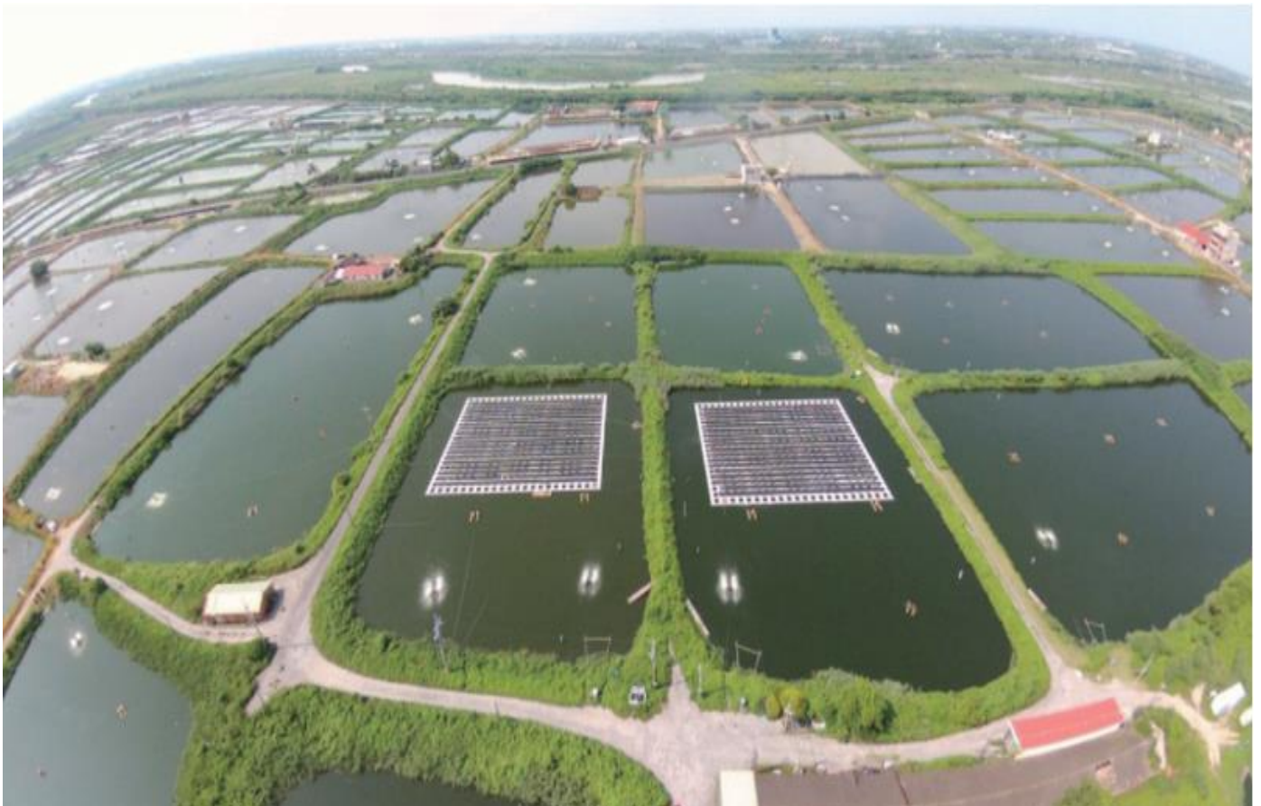
農委會水試所試驗基地的浮式光電

農委會考量避免農地零碎化，於 109 年 7 月 7 日調整農地設置太陽光電之政策，限縮 2 公頃以下農地變更要件，影響太陽光電可設置土地空間。