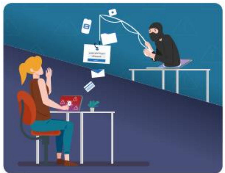
網路釣魚利用盲點設陷，在人眼對文字、圖像辨識的模糊下，讓人被導入惡意程式、病毒而成為受害者。

主動者還有可能誤觸網路裡設下的圈套陷阱，您經常聽到的「網路釣魚」就是如此。設陷者用各式盲點，針對人眼對文字、圖像辨識模糊與好奇，例如“ICCL”與“iccl”，您有無看到前者的“l”是後者的“1”呢？讓您不經意進入異