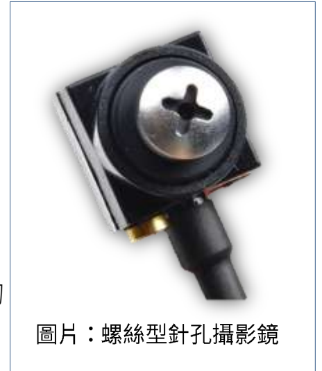
圖片：螺絲型針孔攝影鏡

注意各處的插座孔、浴鏡、火災偵測器、燈座、天花板、鑰匙孔、冷氣孔、電話（可能遭竊聽）與衣櫥上方等處，並留意住所週遭是否有可疑的電纜線。