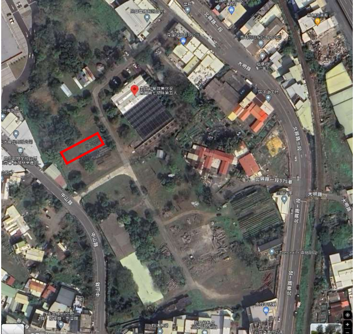
地點：新竹分署竹東貯木場