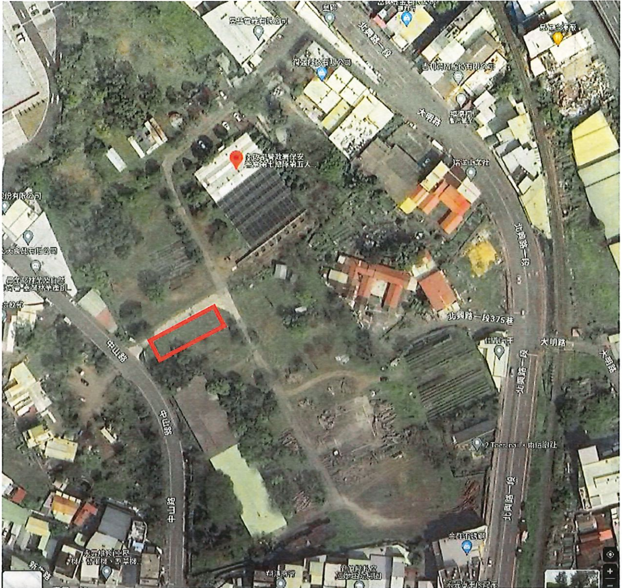
地點：新竹分署竹東貯木場