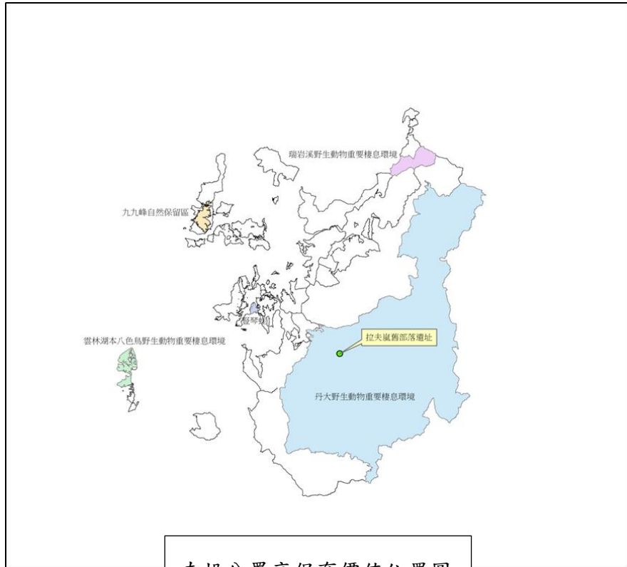
南投分署高保育價值位置圖