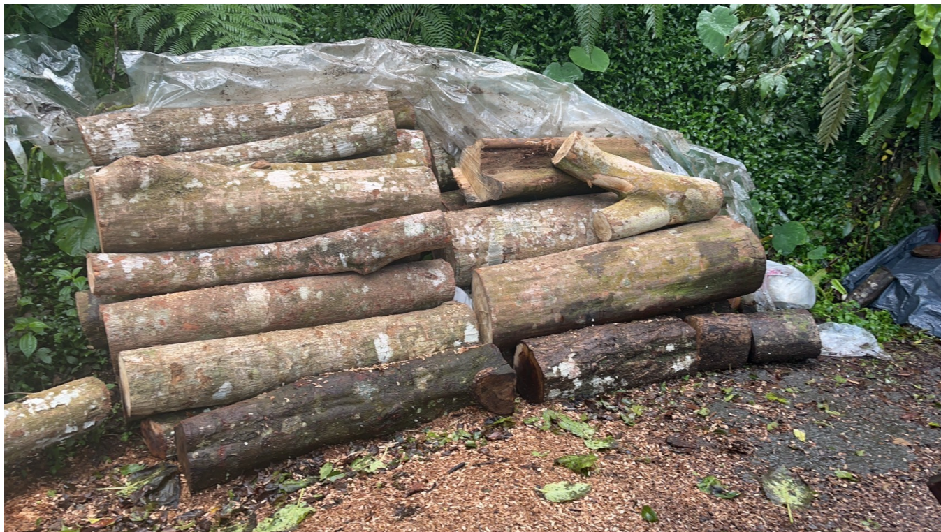
大埔 224 林班現場堆置木材情形