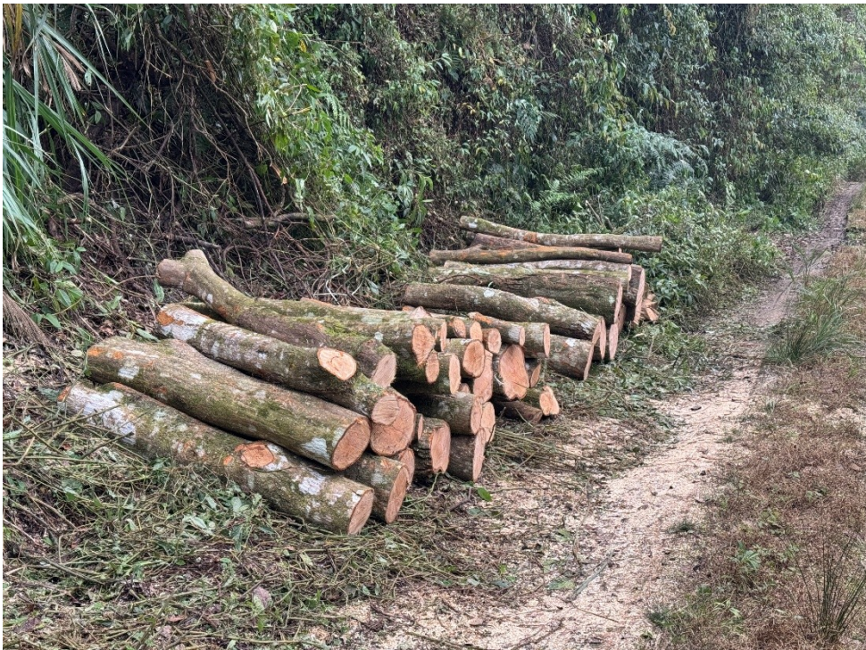
阿里山及大埔事業區林班現場堆置木材情形